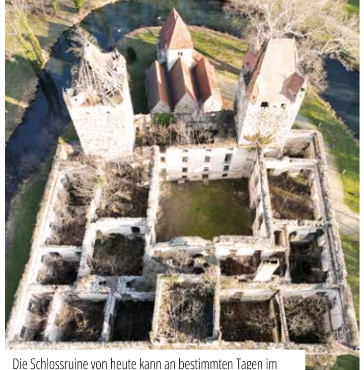
Die Schlossruine von heute kann an bestimmten Tagen im Jahr bei einer Führung besichtigt werden.

für die Artenvielfalt zu schaffen. Dank der Unterstützung von Bezirkshauptmann winkl. Hofrat Helmut Leiss gelang dieser Kompromiss. Seit 1978 ist der Park Naturdenkmal , seit 2013 steht er zudem unter Denkmalschutz – nicht nur eine ehrenvolle Auszeichnung, sie sichert uns heute auch wertvolle Förderungen des Bundesdenkmalamtes.