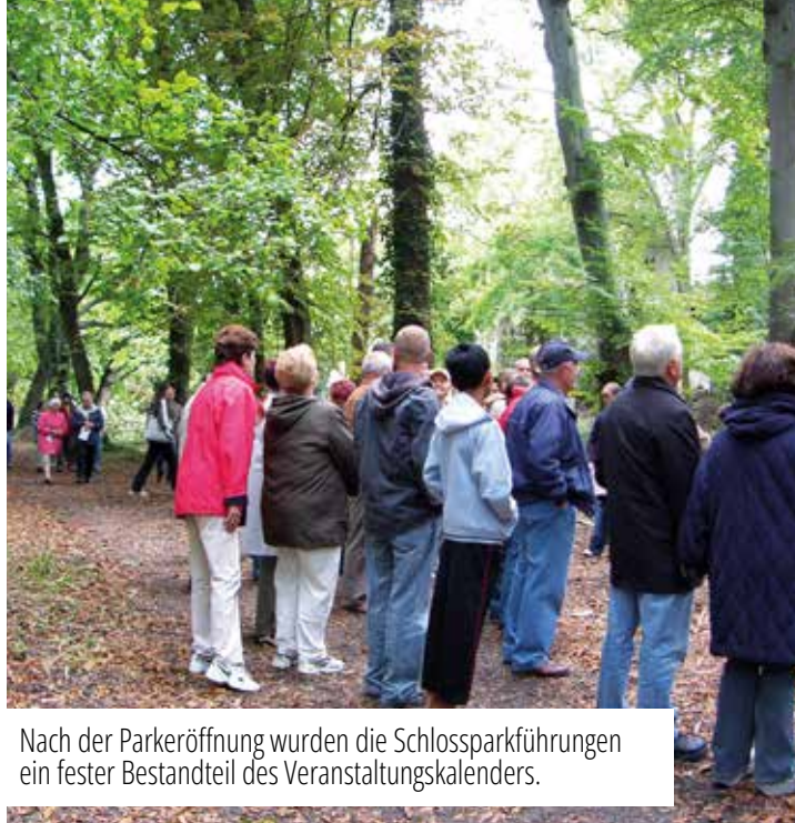
Nach der Parkeröffnung wurden die Schlossparkführungen ein fester Bestandteil des Veranstaltungskalenders.

Bei einer großen Führung durch das Areal (inkl. Schlossinsel) wurden die Errungenschaften der letzten Jahre im Park gewürdigt und natürlich auch gebührend gefeiert.