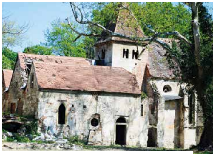
Eindrucksvoll zeigen diese Vorher-Nachher-Fotos, wie sehr es sich lohnen kann, Altes zu bewahren.

Was Sie dieses Jahr noch an kulturellen Highlights in diesen Mauern erwartet, finden Sie in unserem Veranstaltungskalender auf der letzten Seite dieser Schlossparkzeitung. Lassen Sie sich die Gelegenheit nicht entgehen, diesen „gehobenen Schatz“ selbst zu erleben!