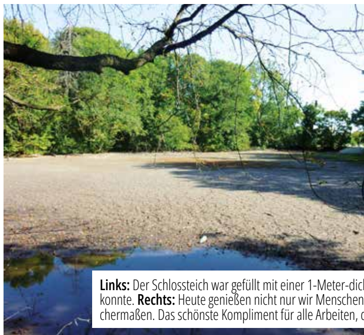
Links: Der Schlossteich war gefüllt mit einer 1-Meter-dicken Schlammschicht, die sich über Jahrzehnte ansammeln konnte. Rechts: Heute genießen nicht nur wir Menschen die wunderbare Aussicht. Es gedeihen Flora und Fauna gleichermaßen. Das schönste Kompliment für alle Arbeiten, die dafür notwendig waren.