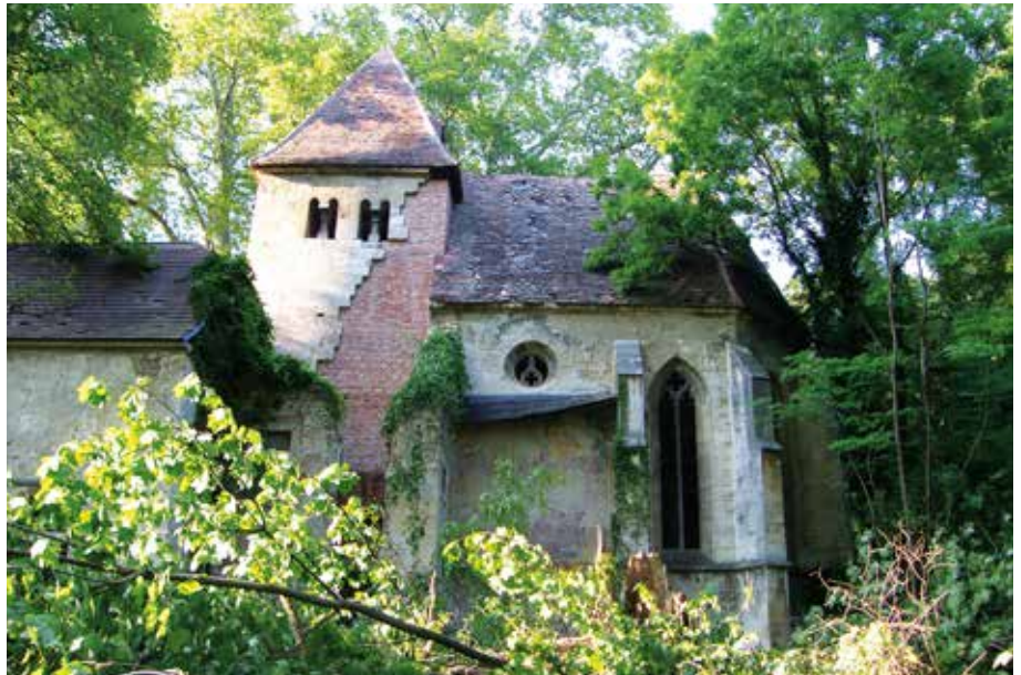
Oben: Die Kapelle musste erst behutsam freigelegt werden, um das Ausmaß der Beschädigung beurteilen zu können. Unten: Der Chor konnte vollständig gerettet und die Wandgemälde teilweise wieder zum Vorschein gebracht werden.