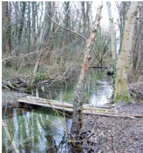
Foto links oben: Der Baumbestand überwucherte gemeinsam mit dem Unterholz über Jahrzehnte den Park. Stück für Stück musste alles ausgelichtet und die Wege neu angelegt werden.

Foto links unten: Auch der Schlossgraben rund um die Schlossinsel konnte nur noch erahnt werden.