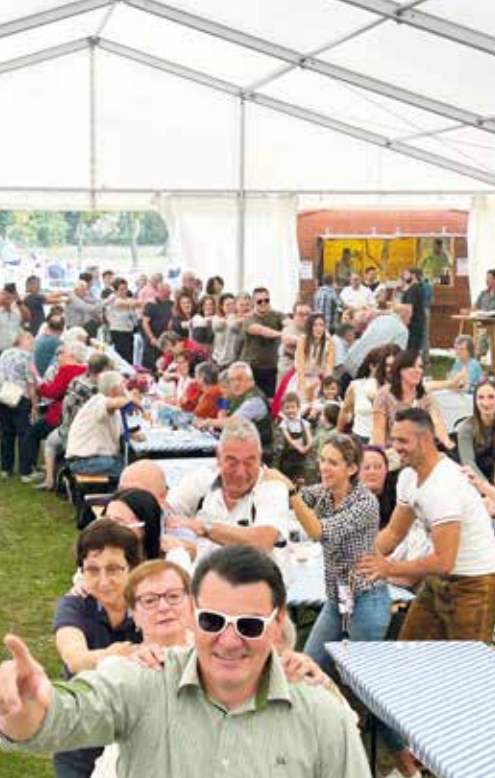
Selbstverständlich darf auch die stimmungsvolle Polonaise im Zeltbetrieb nicht fehlen.