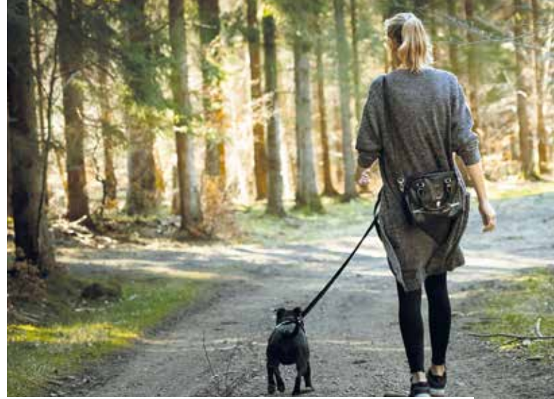
Für ein gutes Miteinander: Hunde bitte immer an der Leine führen.

Elisabeth Waidacher, Öffentlichkeitsarbeit Marktgemeinde Pottendorf