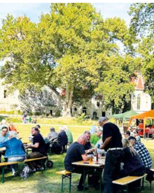
Bei herbstlichem Kaiserwetter fanden die letzten Oktoberfeste im Schlosspark statt. Und auch die Kinder hatten ihre Gaude in der Hüpfburg.