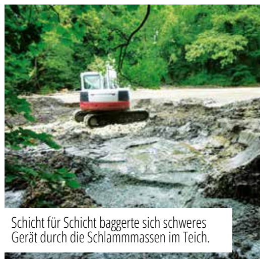
Schicht für Schicht baggerte sich schweres Gerät durch die Schlammmassen im Teich.

als je zuvor. Gleichzeitig wurde das Umfeld aufgewertet: Die Johann-Zisser-Straße wurde saniert und der Zugang von der Wiener Straße in einen modernen Geh- und Radweg verwandelt. Und wer heute von der Tattendorfer Seite über die kleine Steinbrücke flaniert, bekommt eine ganz besondere Sicht auf die Natur, die an diesem Platz einfach sein darf, wie sie ist.