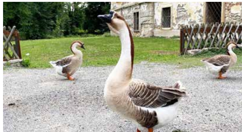
Die Höckergänse lieben die Schlossinsel genauso wie wir und haben stets ein wachsames Auge auf sie.