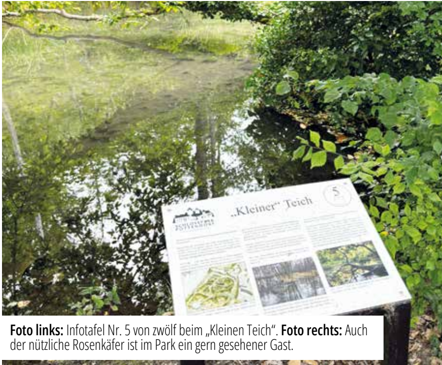
Foto links: Infotafel Nr. 5 von zwölf beim „Kleinen Teich“. Foto rechts: Auch der nützliche Rosenkäfer ist im Park ein gern gesehener Gast.