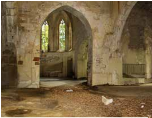
Oben: Auch das Mittelschiff war stark in Mitleidenschaft gezogen. Unten: Das erhaltene Sakramentshäuschen im Chor der Kapelle.