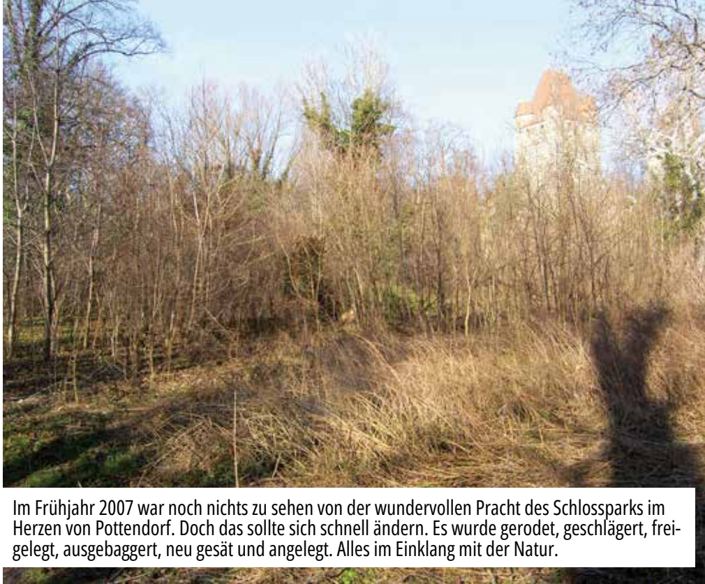
Im Frühjahr 2007 war noch nichts zu sehen von der wundervollen Pracht des Schlossparks im Herzen von Pottendorf. Doch das sollte sich schnell ändern. Es wurde gerodet, geschlägert, freigelegt, ausgebaggert, neu gesät und angelegt. Alles im Einklang mit der Natur.

Manche Entscheidungen prägen eine Gemeinde über Generationen hinweg.