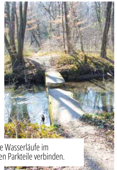
Eine der neun Brücken, die über alle Wasserläufe im Schlosspark führen und die einzelnen Parkteile verbinden.