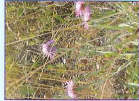
Berghexe auf Wiesen-Flockenblume

kommt weltweit nur im Steinfeld vor - eine der letzten Populationen der vom Aussterben bedrohen Tiere gibt es in Siegersdorf